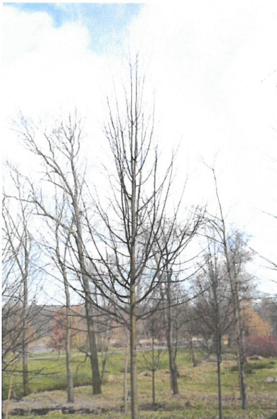
Strom č. 6 – potlačení konkurenčních úzce nasazených výhonů s podporou jediného terminálu - před zásahem