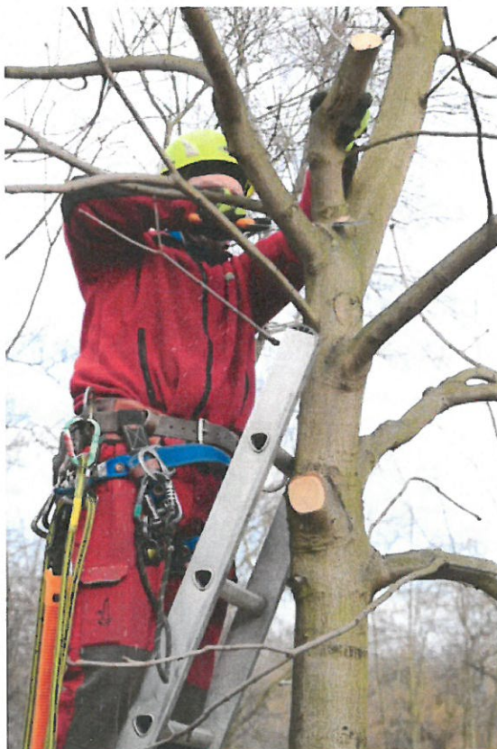
Strom č. 7 – prevence vzniku tlakového větvení odstraněním konkurenční větve z úžlabí - před zásahem