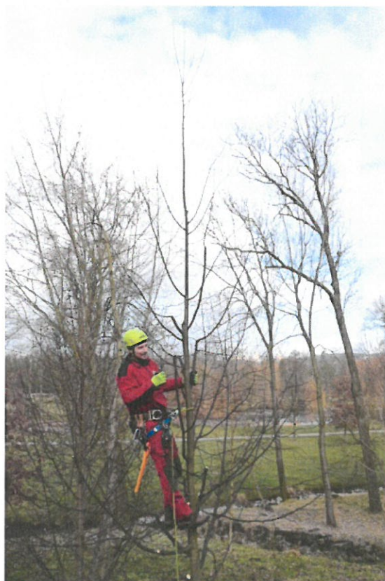
Strom č. 6 – potlačení konkurenčních úzce nasazených výhonů s podporou jediného terminálu - po zásahu