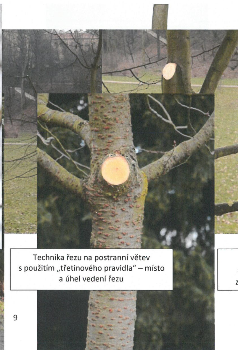
Technika řezu na postranní větev s použitím „třetinového pravidla“ – místo a úhel vedení řezu