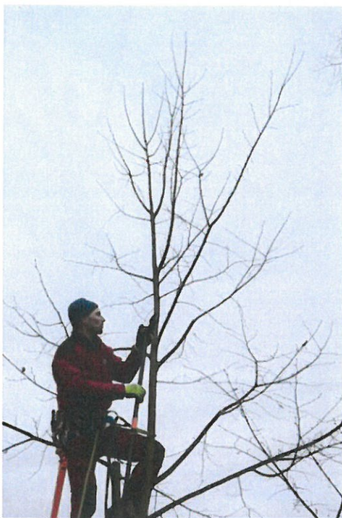
Strom č. 2 – technika potlačení výhonů konkurující terminálu - před zásahem