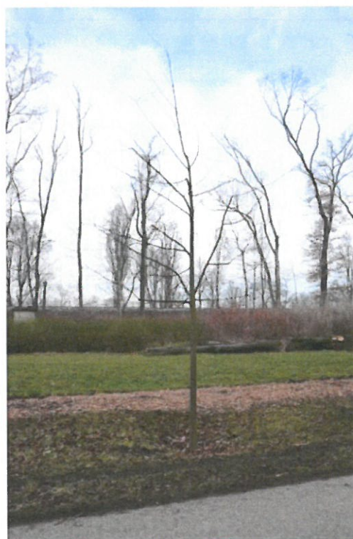
Strom č. 4 – lípa s řídkou korunou a podpořeným jediným terminálem po zásahu