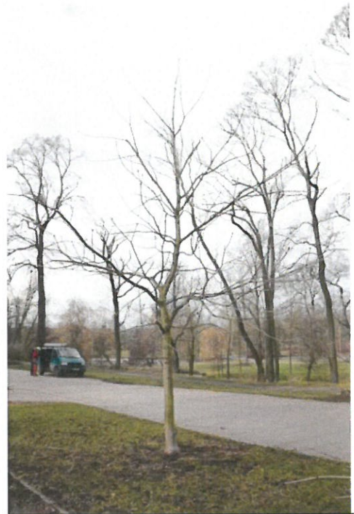
Strom č. 7 – jírovec s nízko zapěstovanou korunou po zásahu