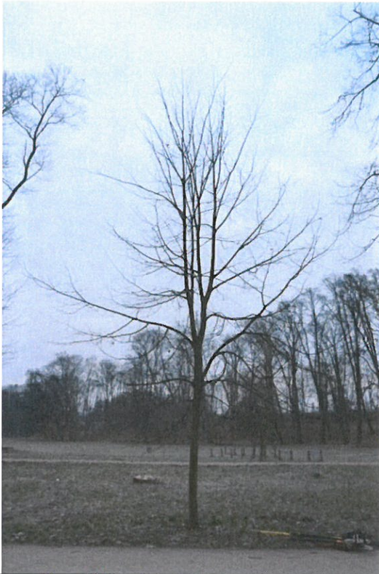
Strom č.2 – lípa s konkurenčními výhony před zásahem