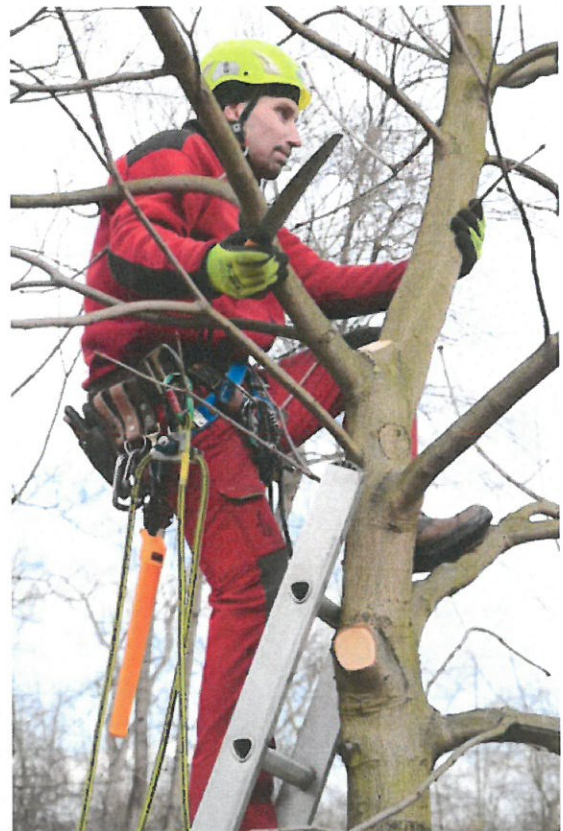
Strom č. 7 – prevence tlakového větvení odstraněním konkurenční větve z úžlabí - po zásahu