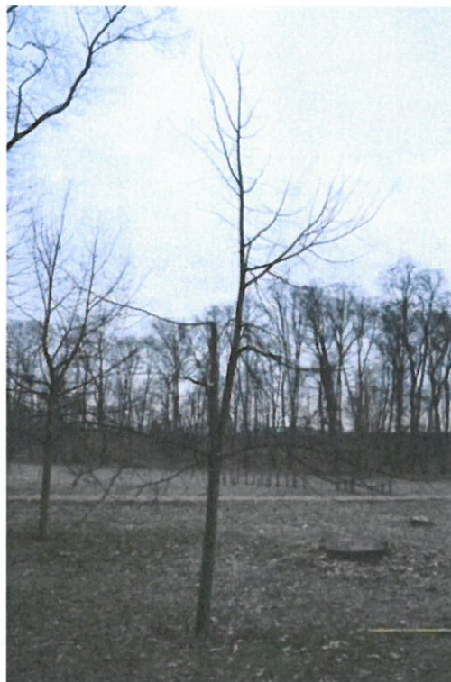
Strom č. 1 – lípa po zásahu - řešení kodominantního větvení - Varianta A – potlačení konkurenční větve