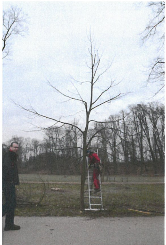
Strom č. 2 – lípa s konkurenčními výhony po zásahu – podpora jediného terminálu