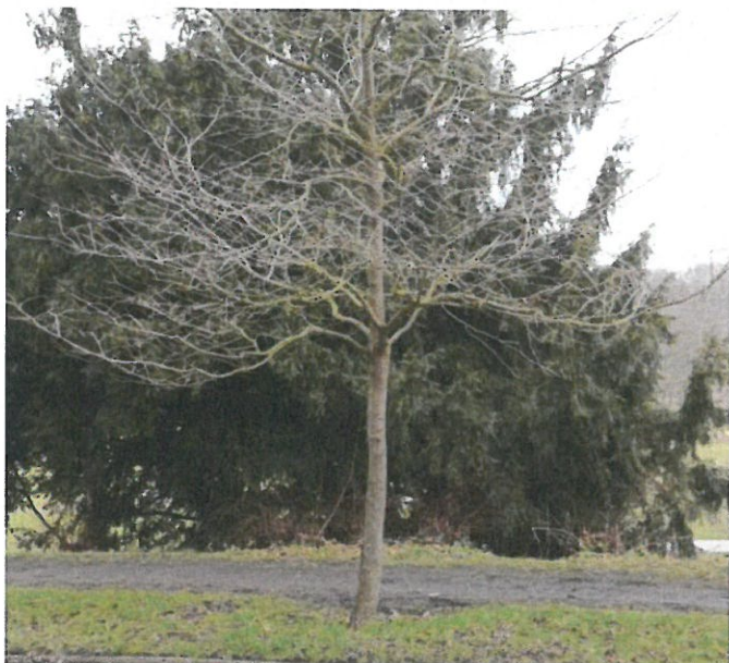
Strom č. 5 – sakura s nízkým provozním profilem koruny před zásahem