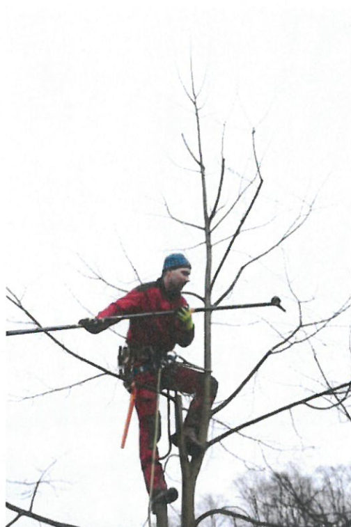
Strom č. 2 – technika potlačení výhonů konkurující terminálu - po zásahu