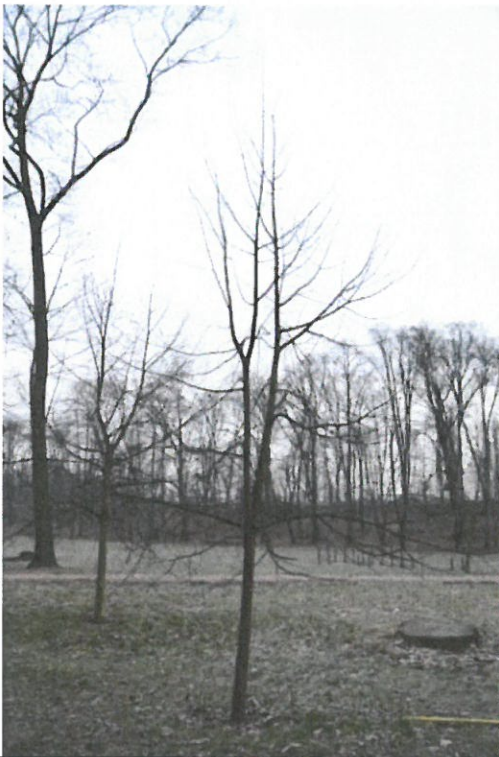
Strom č. 1 – lípa s kodominantním tlakovým větvením - před zásahem