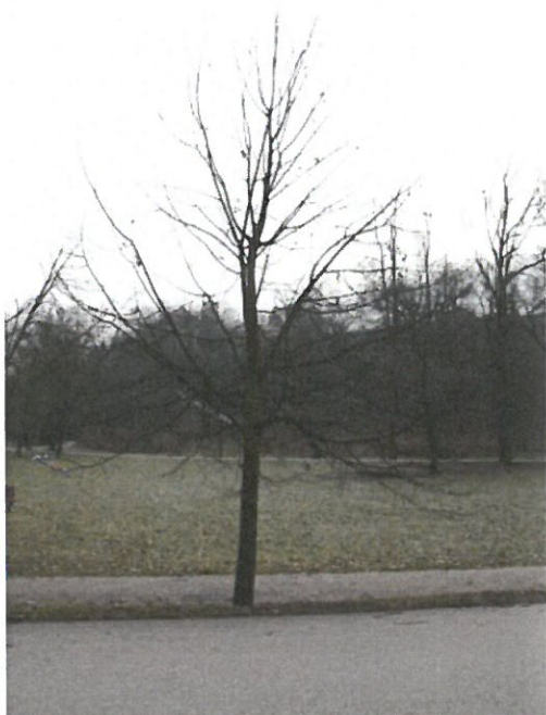
Strom č. 3 – lípa s přehoustlou korunou před zásahem