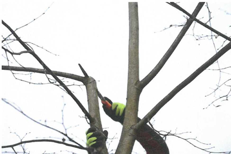
Potlačení konkurenční větve zkrácením o min. 50 % její původní délky technikou řezu na postranní větev