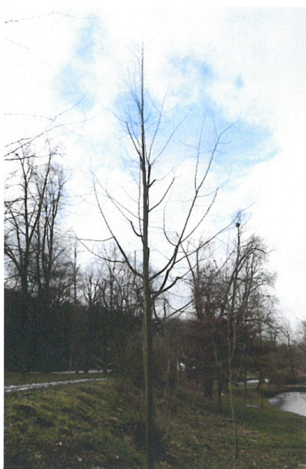
Strom č. 6 – lípa s prosvětlenou korunou a podpořeným terminálním výhonem po zásahu