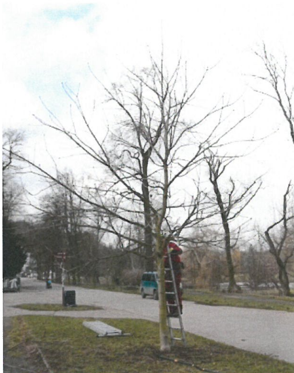
Strom č. 7 – jírovec s nízko zapěstovanou širokou korunou před zásahem