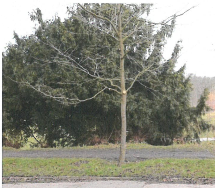
Strom č. 5 – sakura s vyzvednutým provozním profilem koruny po zásahu