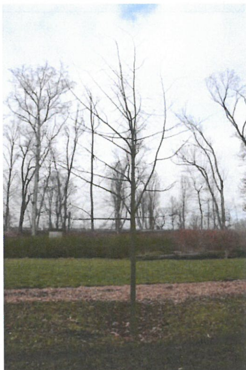
Strom č. 4 – lípa s řídkou korunou a konkurenčními výhony před zásahem