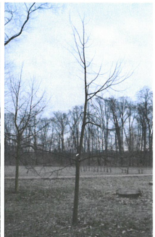
Strom č. 1 – lípa po zásahu - řešení kodominantního větvení - Varianta B – úplným odstraněním