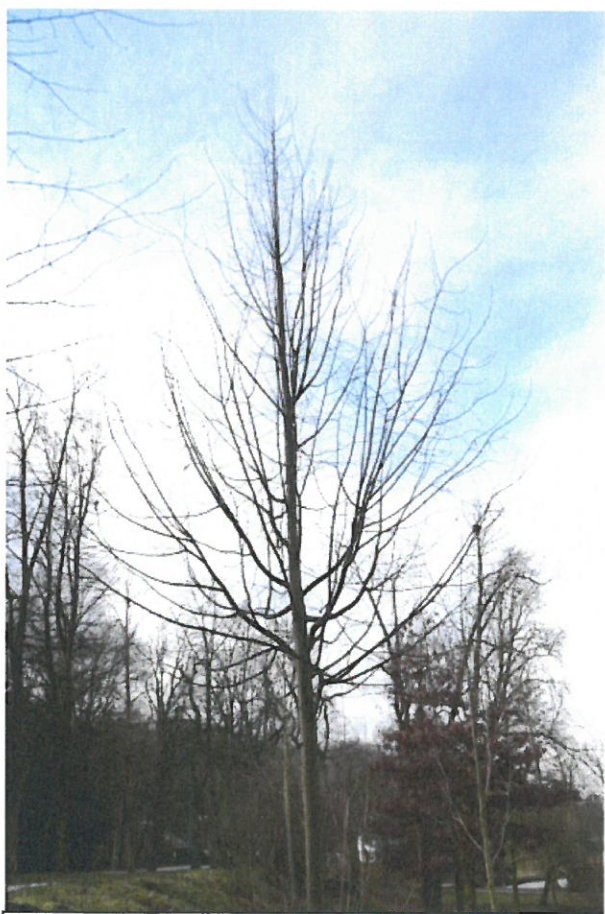
Strom č. 6 – lípa s bujnou hustou korunou konkurenčními výhony před zásahem