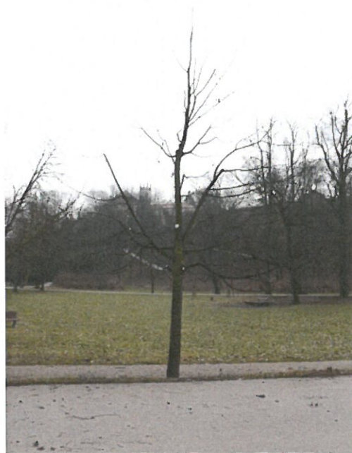
Strom č. 3 – lípa s přehoustlou korunou po zásahu