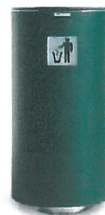
KOŠ OCELOVÝ ŽÁROVĚ POZINKOVANÝ (VÁLCOVÉHO TVARU) OPATŘEN MATNÝM METALICKÝM NÁTĚREM DO EXTERIÉRU (barva: matná metalická tmavě šedá) OBJEM: 80l